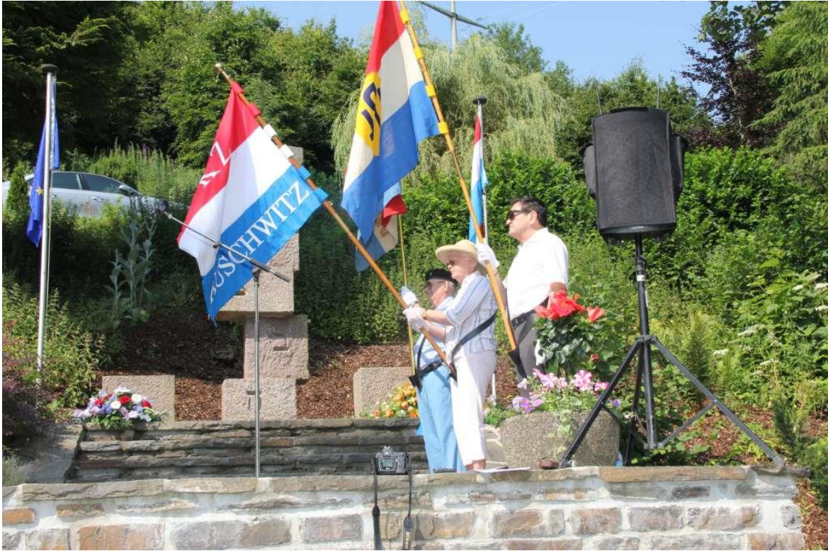
Le drapeau du Comité Auschwitz devant le Monument.