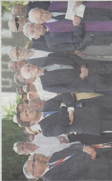
Le Premier ministre Bettel (4ème de la g.) a lui aussi rejoint la cérémonie

Déportations de Juifs: émouvante commémoration à Cinqfontaines