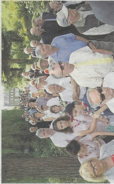
Le public est venu nombreux