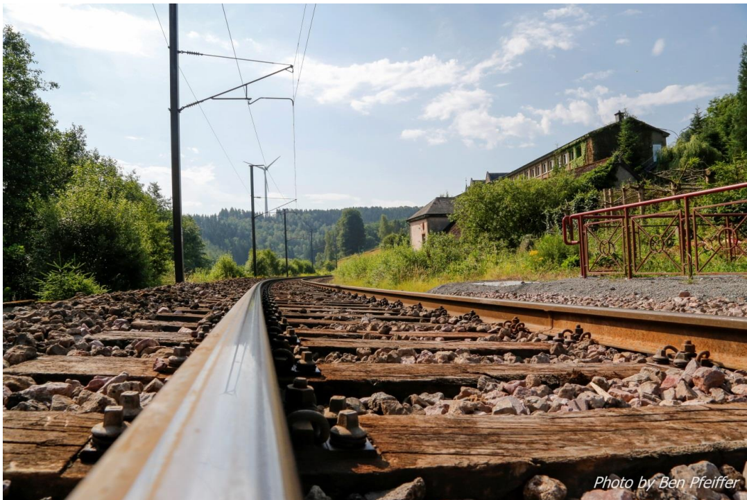
Le site de Cinqfontaines