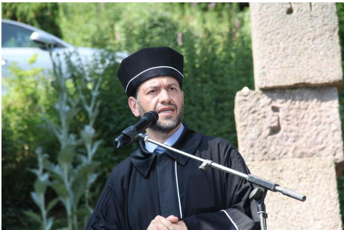
Le Grand Rabbin de Luxembourg M. Alain Nacache