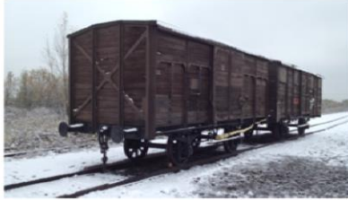
Wagon de déportation près de la « Judenrampe » à Auschwitz-Birkenau (2013).

Rendez-vous au Monument à 10.15 heures. Une réception sera offerte après la cérémonie par Monsieur le Bourgmestre et le Collège échevinal de la commune de Wincrange.